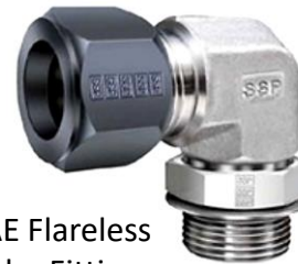
SAE Flareless Tube Fittings