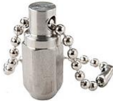
Herramienta de marca de profundidad