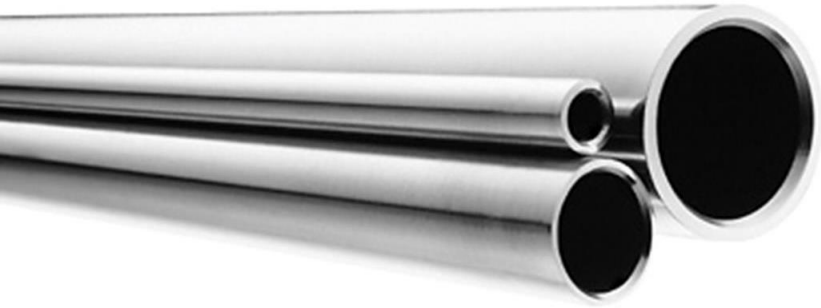
Acero inoxidable recto