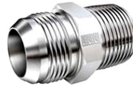
JIC Fittings | SAE 37° Flared Fittings