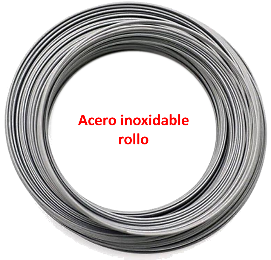
Acero inoxidable rollo