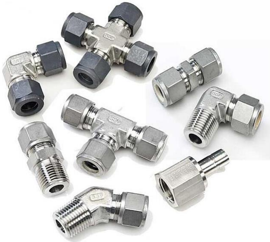
Conectores OD / NPT