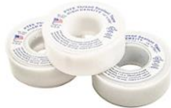
Cinta PTFE - Teflón