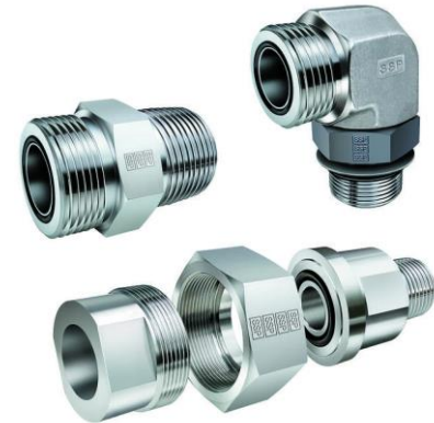
SAE O-Ring Face Fittings