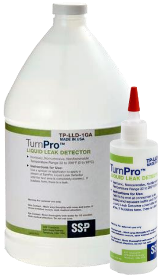
Líquido detector de fugas