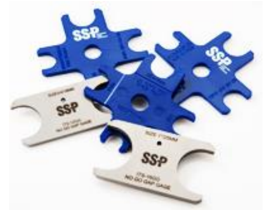
Galgas de calibración